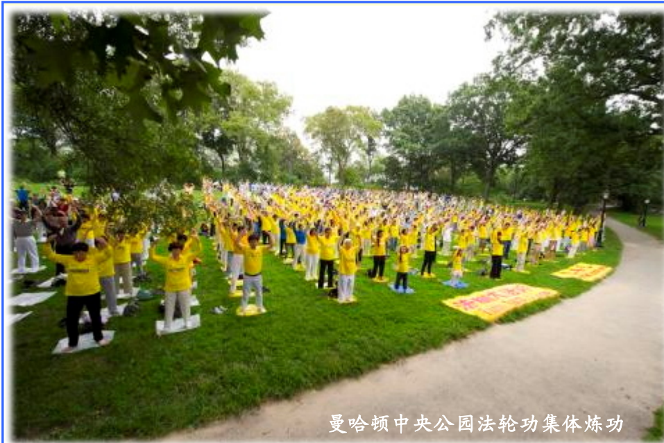
曼哈顿中央公园法轮功集体炼功