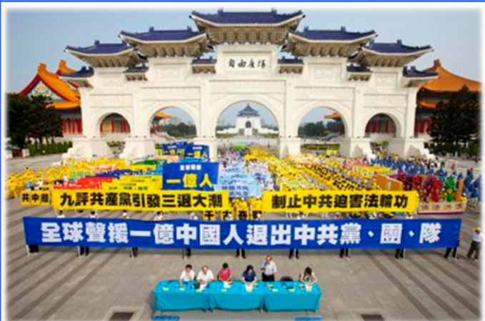
台湾声援一亿中国人三退