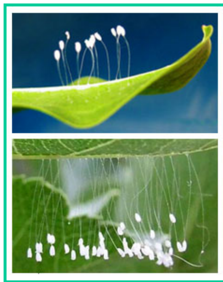
开在绿叶上的优昙婆罗花

据我所知，法轮功炼功群体一直在告诉人们孰恶孰善，和善恶必报的普世天理。从而让人们弃恶从善，选择一个美好的未来。以上祥瑞事物的面世，正是上天在慈悲世人，在点悟天下苍生要顺天而行，远恶近善。从精神上退出中共的一切党、团、队组织，自退自救自平安，心存真、善、忍，牢记法轮大法好，这才是顺天意而行，迎福纳祥的明智之举。