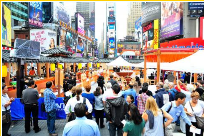
中国菜厨艺大赛 盛唐古长安再现纽约时代广场