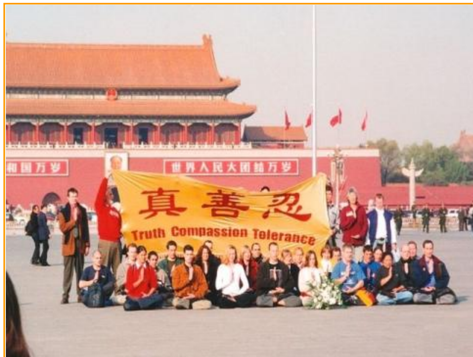
历史今日 10 年前 36 位西方人来到北京上访