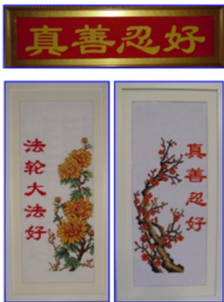
十字绣作品：真善忍好

弟子的每一天都是对师父的感恩，弟子也定会谨记师父的谆谆教诲，做的更好，在新年来临之际，弟子合十，恭祝师父新年好！