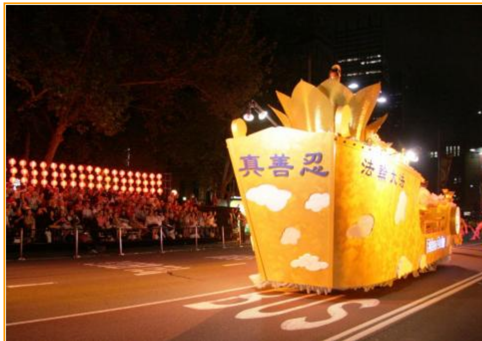
悉尼新年大游行 法轮功团体传福音