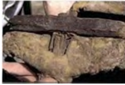
恐龙时代的人造铁锤

综观上面的几个考古发现，我们不免在心中产生了一个很大的疑问：那就是为什么这些考古发现所呈现出来的观点，与我们现有的认识大不相同，甚至与在学校中的教科书内容有很大的抵触？记得教科书中告诉我们，人类最早起源于约三万年前，并且是由猿类进化而来的。如果人类历史真的如教科书所说的只有数万年，那对于这些在上亿年前所存在的足迹与金属制品又该如何解释呢？