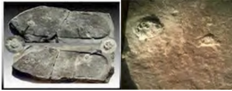
踩在三叶虫上的远古脚印