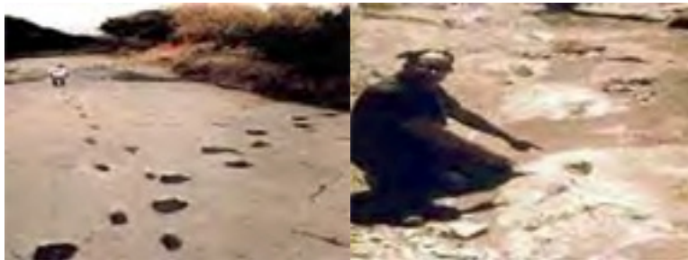
河床中发现的白垩纪恐龙脚印与人的脚印交错而行！

在美国得克萨斯州 Glen Rose 的瑞拉克西河（Raluxy）河床中发现有生活在白垩纪的恐龙的脚印。考古学家们吃惊地在恐龙脚印化石旁十八英寸半的地方，同时发现有 12 具人的脚印化石，甚至有一个人的脚印叠盖在一个三指恐龙脚印上。把化石从中间切开，发现脚印下的截面有压缩的痕迹，这是仿制品无法做到的，显然不是假冒的。另外在附近同一岩层还发现人的手指化石和一件人造铁锤，有一截手柄还紧紧留在铁锤的头上。这个铁锤的头部含有 96.6%铁，0.74%硫和 2.6%氯。这是一种非常奇异的合金。现在都不可能造出这种氯和铁化合的金属来。一截残留的手柄已经变成煤。要想在短时间内变成煤，整个地层要有相当的压力，还要产生一定的热量才行。如果锤子是掉在石缝中的，由于压力和温度不够，就不存在使手柄煤化的过程。这说明岩层在变硬、固化的时候，锤子就在那儿了。发现人造工具的岩层和恐龙足迹所在岩层是一致的，而其它岩层都没有恐龙足印和人造工具。这说明人类和恐龙的确曾生活在同一时代。