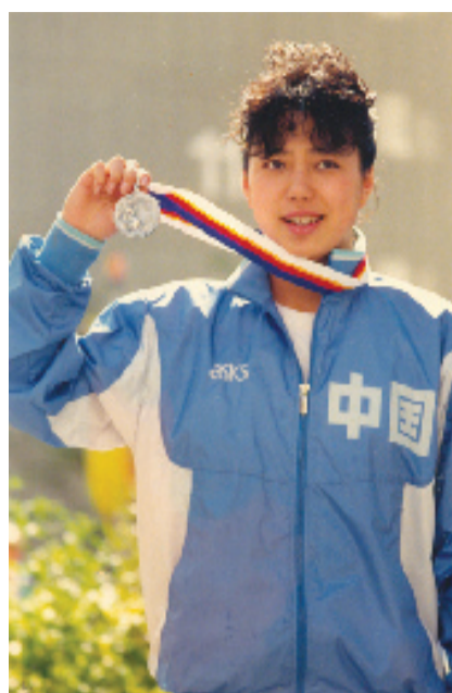
前奥运名将黄晓敏档案照。