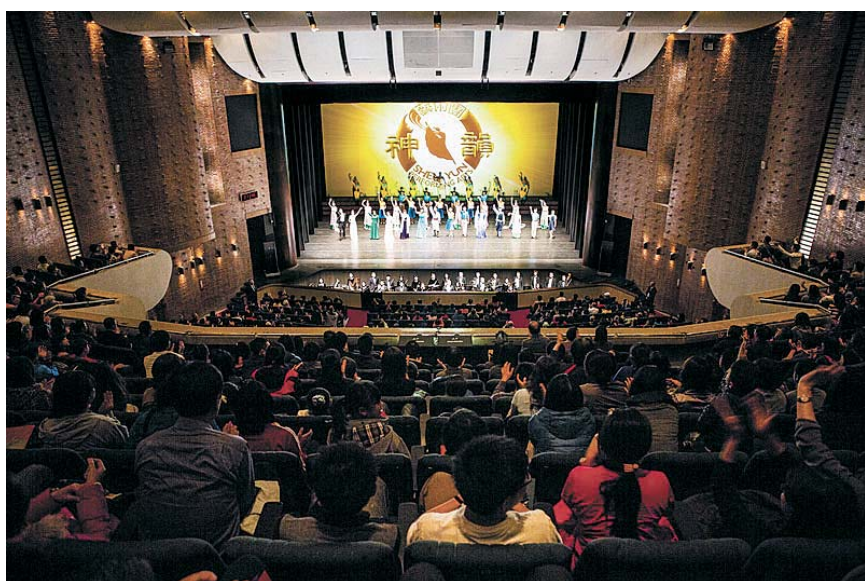
2015年4月12日，神韵纽约艺术团结束嘉义场英雄演艺厅第三场演出，也为在台湾巡回演出划下完美的句点，图为演员谢幕。

他表示：“因为日本、韩国和美国这些潮流，对年轻人冲击太大，而且也不光是怪人民，还有我们的政党和统治者对于文化传承的破坏和不继承，这种不继承导致后