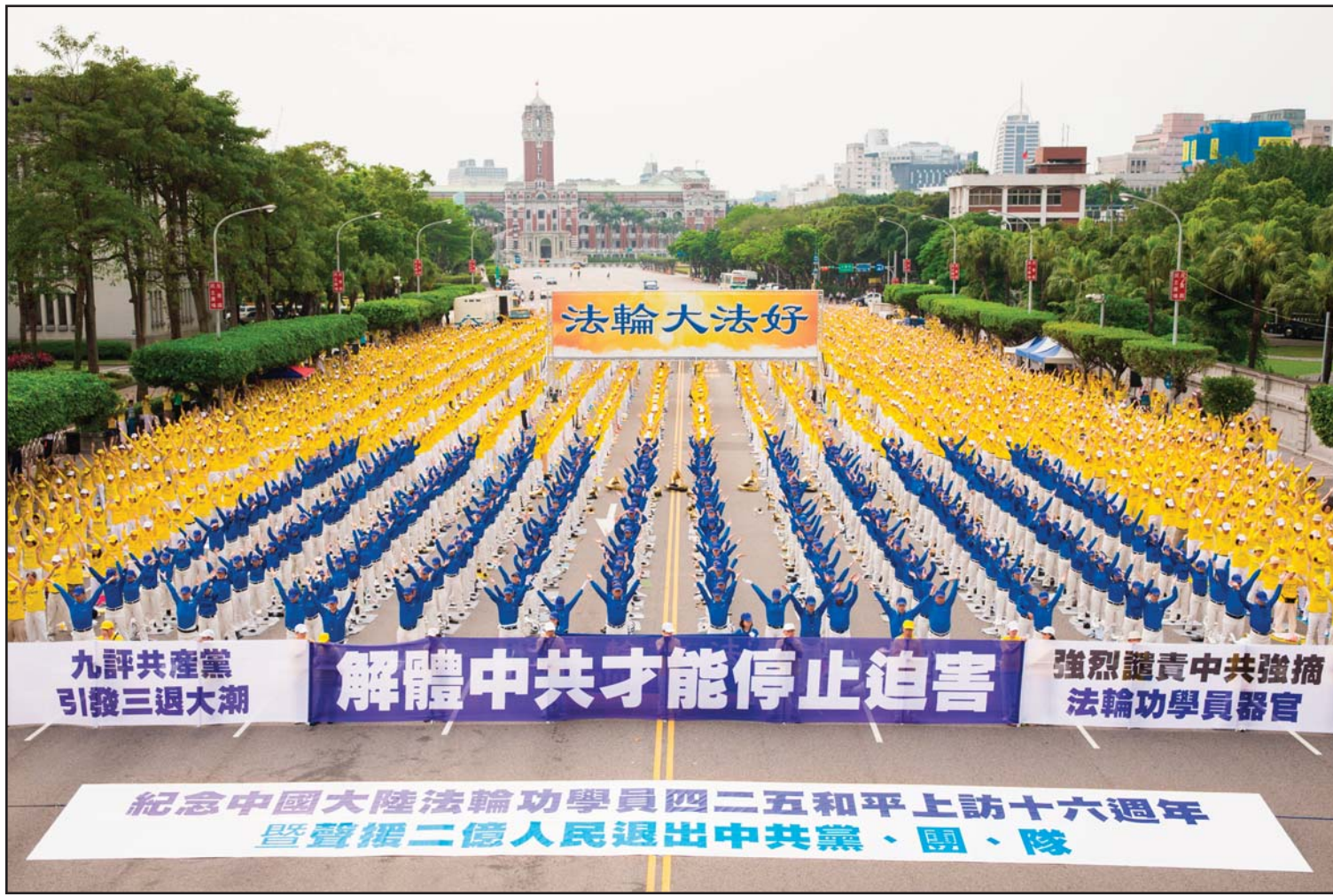
台湾法轮大法学会19日在凯达格兰大道举办「纪念中国大陆法轮功学员四二五和平上访十六周年暨声援二亿人民退出中共党、团、队」活动。图为部分法轮功学员四二五和平上访。

2015年4月14日，在大纪元网站发表声明退出中共党、团、队组织的人数超过两亿人。这一刻将在历史永远定格。这是一个新的历史里程碑，是一件值得庆贺的大事，是中华之福，也是世界之福！