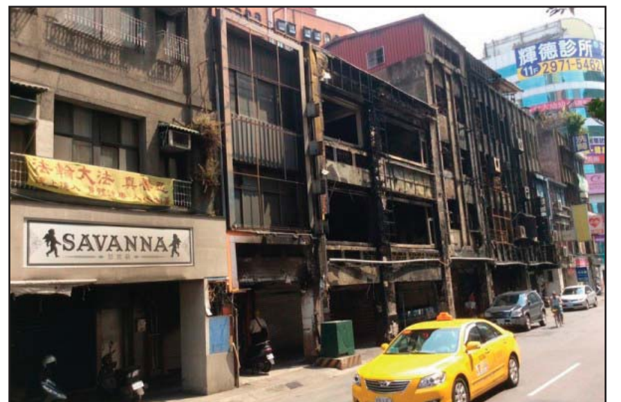
据台湾法轮功学员提供的照片，火灾截止点就在接近横幅处停下来了。

由于火场浓烟不断窜出，加上连日高温干燥及风势较大助燃下，火势迅速延烧。警消表示，原本疑似3楼受困女性，在火警时有冲出来。新北市消防局表示，这场火警灭火期间曾传出爆炸声响，增加灌救困难，初步怀疑是施工装潢不慎引起。◎