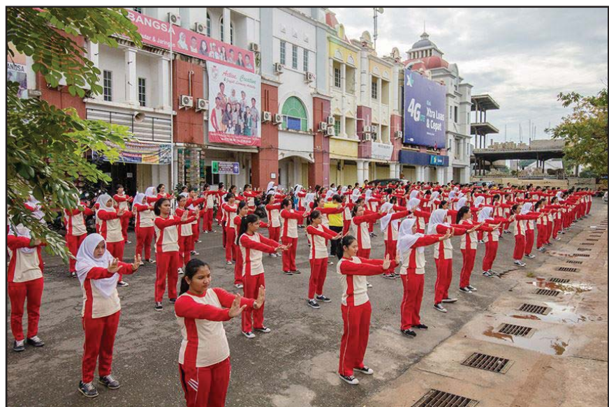
Kolese Tiara Bangsa 高职学生在炼法轮功第一套功法

2016年11月11日和12月10日，印尼巴淡岛法轮功学员来到当地两家学校，Kolese Tiara Bangsa 高职和国立七巴淡高中，向那里的数百在校生介绍法轮功，现场教功，并讲述了过去十七年来中共在中国残酷迫害法轮功学员的事实真相。