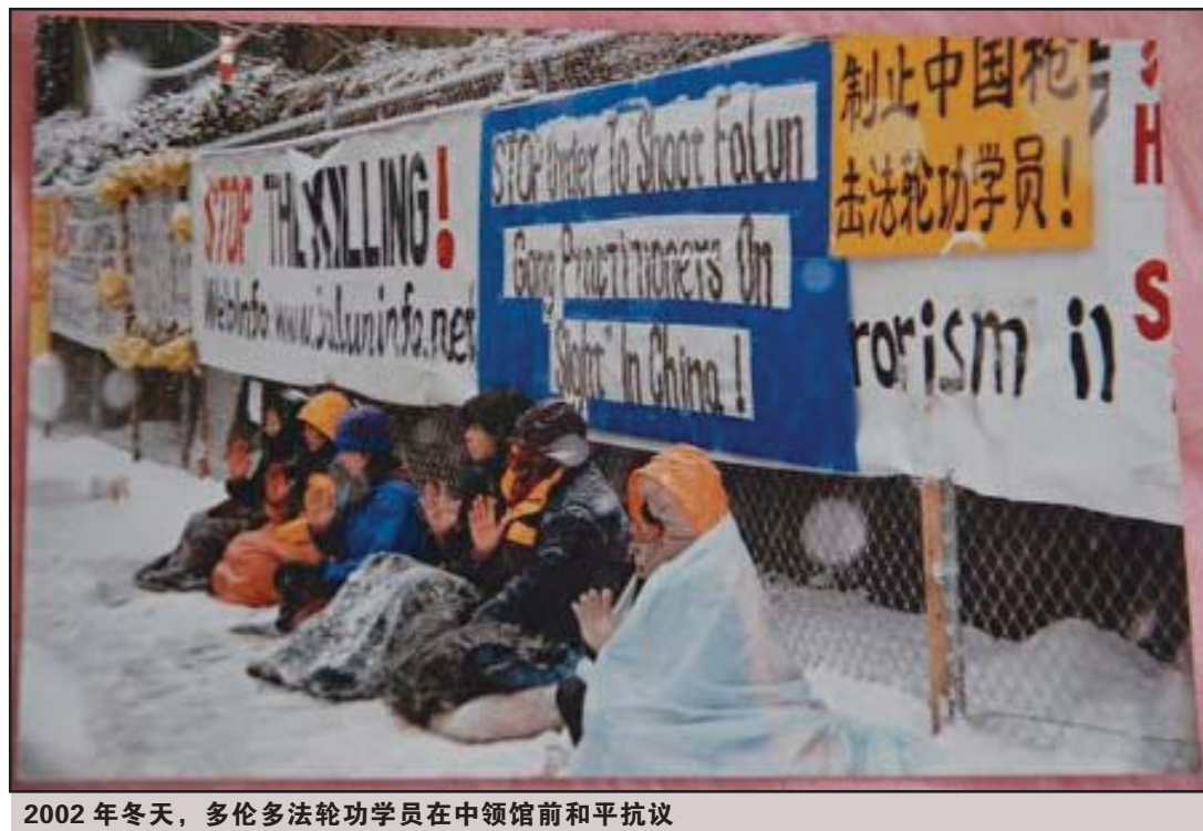
2002年冬天，多伦多法轮功学员在中领馆前和平抗议

就这样，不管多冷，都有法轮功学员守护在那里，他们成了冬天里一道独特的风景。来来往往的人们被他们的举动震撼，人们开始关注他们。有人半夜三更来拿资料；一些过往的西人向他们露出真诚微笑：“你们好！”“保佑你们！”也有人上前与他们握手，“我理解你们”。