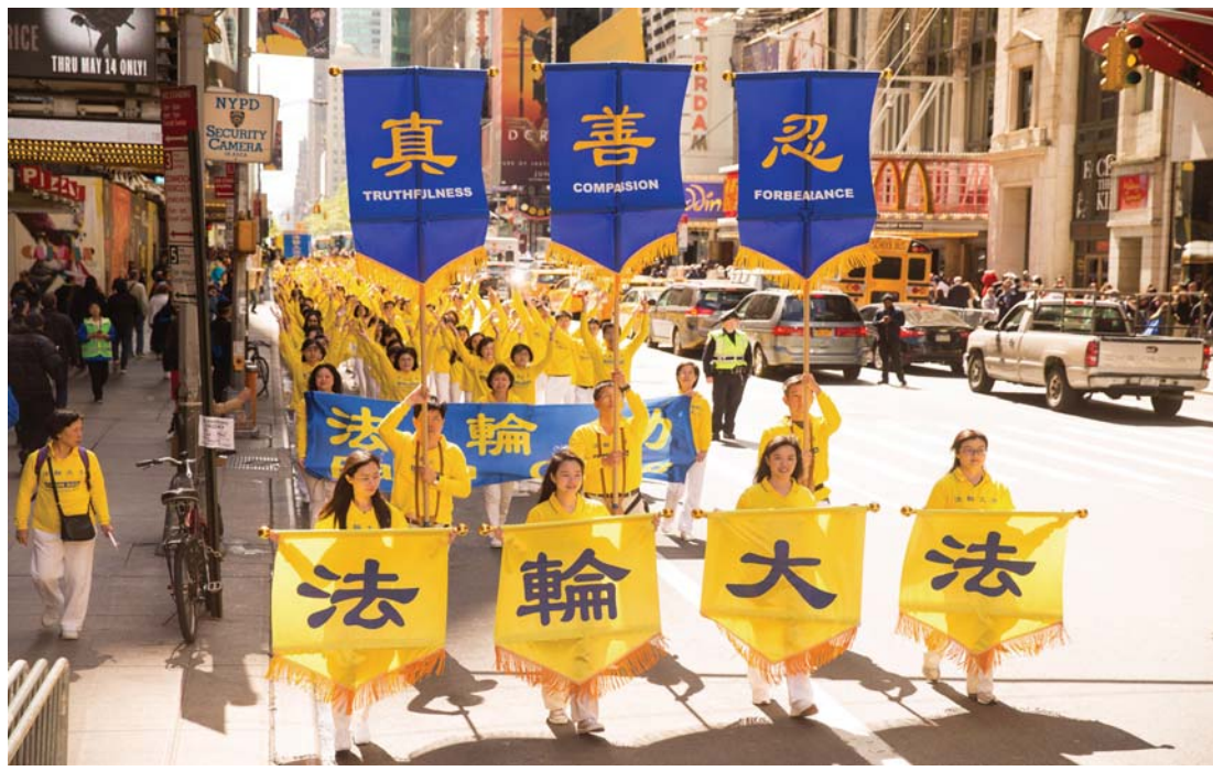
图为2017年5月12日，纽约上万人举行庆祝法轮大法弘传世界25周年活动，并举行横贯曼哈顿中心42街的盛大游行。

为什么当年江泽民及其同党一手制造的对法轮功的残酷镇压可以成功？并且可以延续至今？为什么中国社会可以承认对一个教人向善，从未给社会带来负面影响，对政治毫无兴趣的法轮功的疯狂诬蔑和打压？为什么非要剥夺这群法轮功修炼者健身强身、按“真、善、忍”原则做好人的权利？为什么法轮功修炼者合情、合理、合法的反迫害行为却要遭受来自公权力以国家和法律为名义的迫害？究其原因，这正是半个多世纪的中